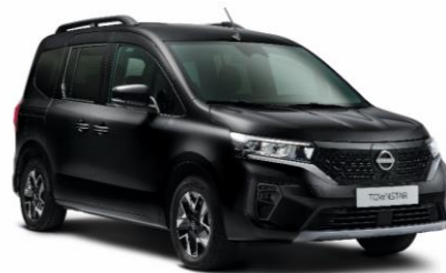
Enigma fekete GNE – 130.000 Ft