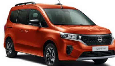
Terrakotta CNZ – 130.000 Ft